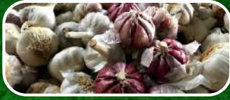
AJO ROJO MORADO