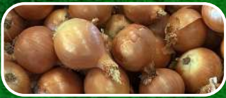
CEBOLLA GRANO DE ORO