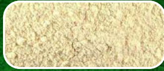
AJO EN POLVO