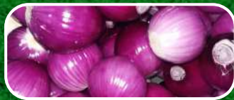
CEBOLLA PELADA ROJA