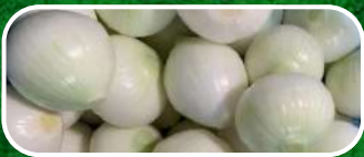
CEBOLLA PELADA BLANCA