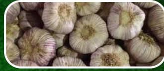
AJO SPRING VIOLETA