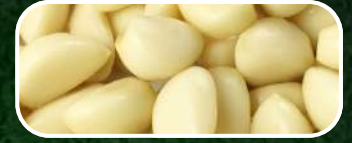
DIENTE DE AJO PELADO