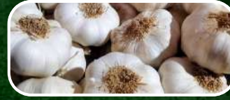
AJO SPRING BLANCO