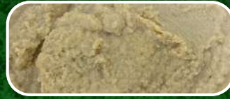
PASTA DE AJO